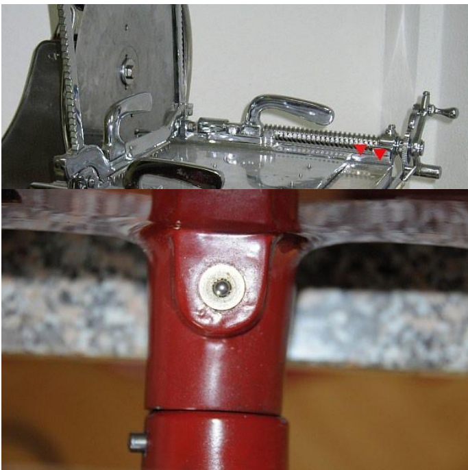
Ein Öl Punkt im Detail unterhalb der Maschine